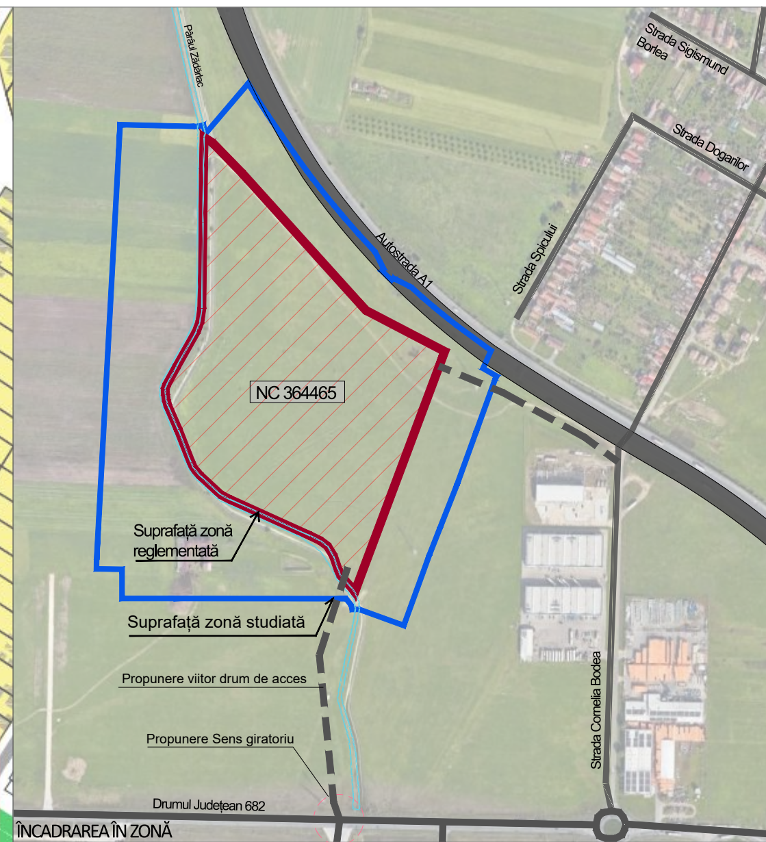
ÎNCADRAREA ÎN ZONĂ