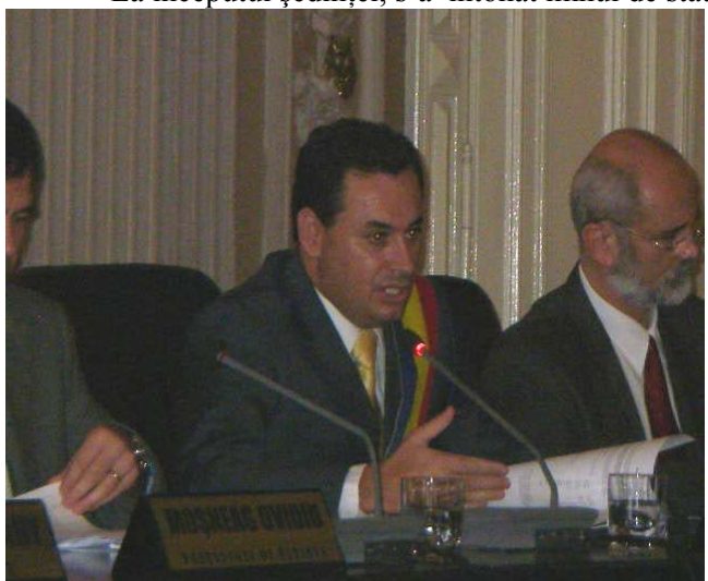
Cu modificările prezentate, domnul primar a supus la vot următoarea

În continuare, domnul primar a notificat retragerea de pe ordinea de zi a următoarelor proiecte de hotărâri înscrise pe ordinea de zi la punctele: 7, 14, 15, 16, 20.