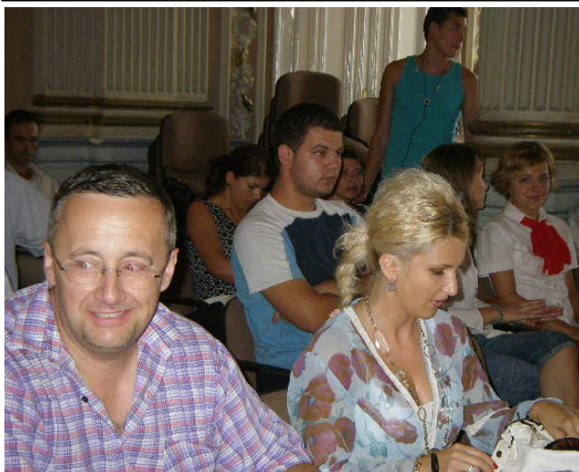
La începutul ședinței, s-a intonat imnul de stat.