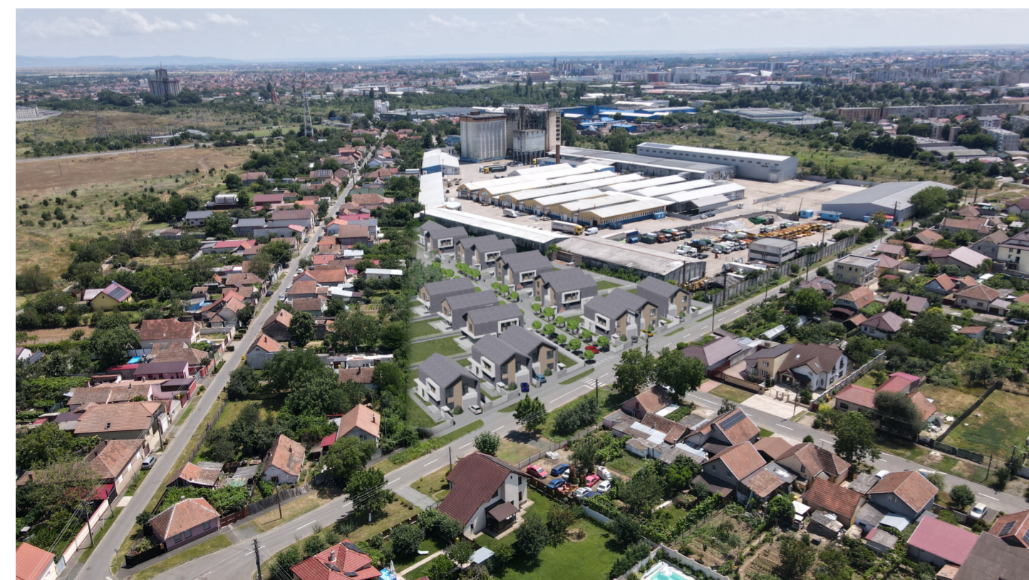
PERSPECTIVA AERIANA INSERTIE IN SITU Str. AGRICULTORILOR colt cu Str. LIVEZILOR