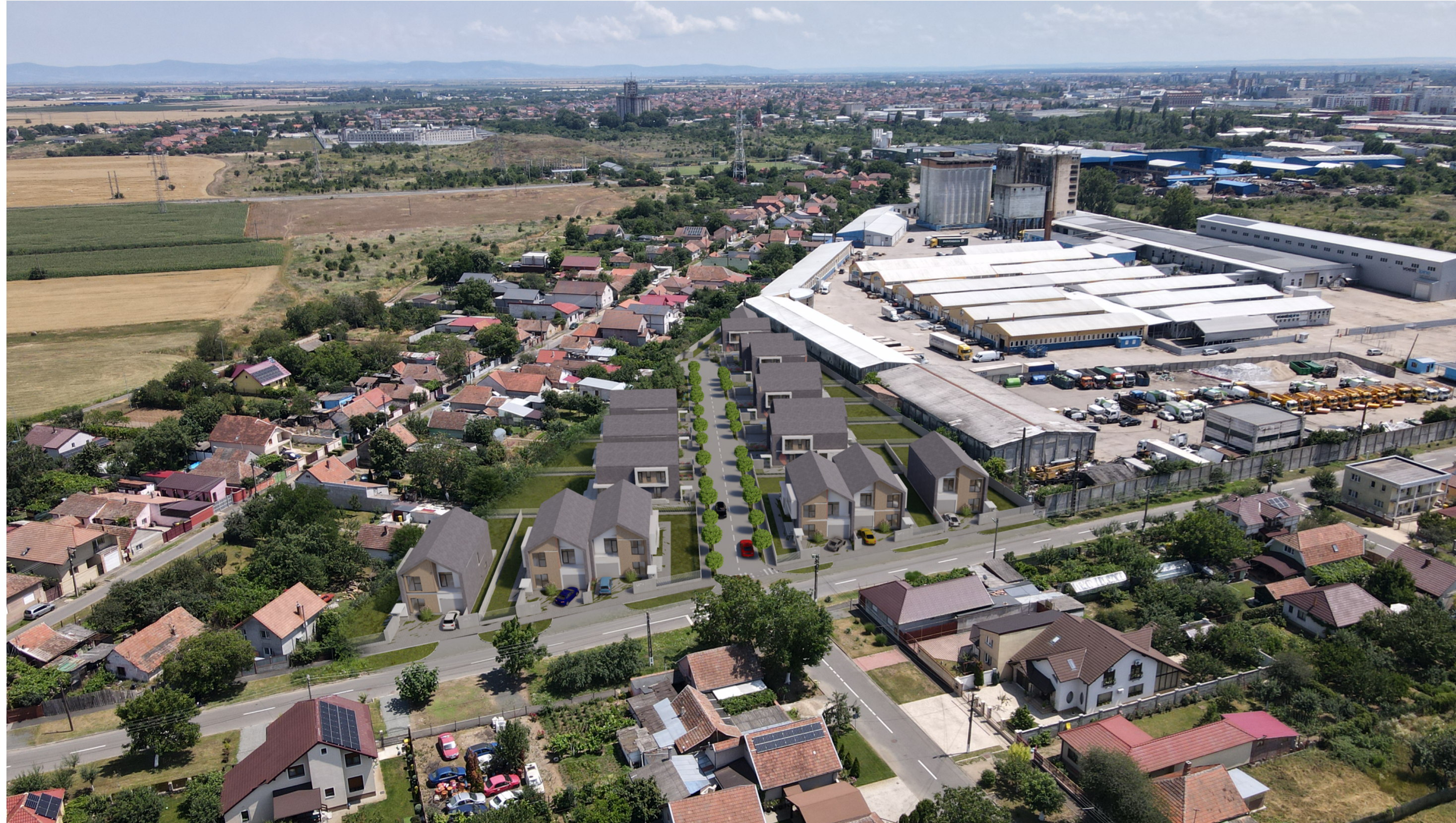
PERSPECTIVA AERIANA INSERTIE IN SITU Str. AGRICULTORILOR