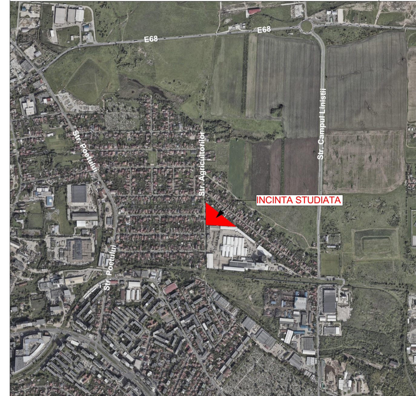
PLAN DE ÎNCADRARE ÎN ZONĂ