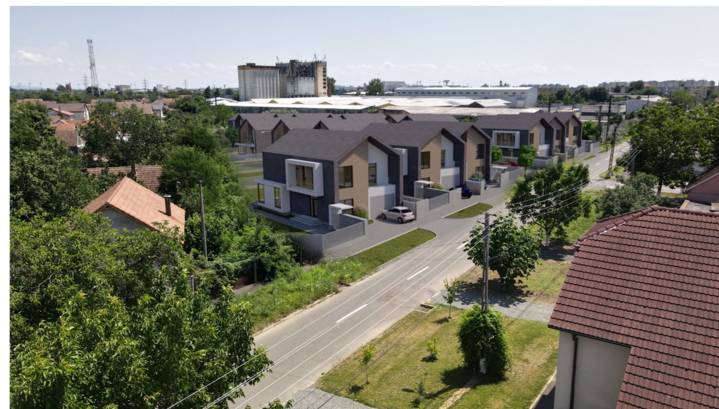
PERSPECTIVA AERIANA INSERTIE IN SITU Str. AGRICULTORILOR