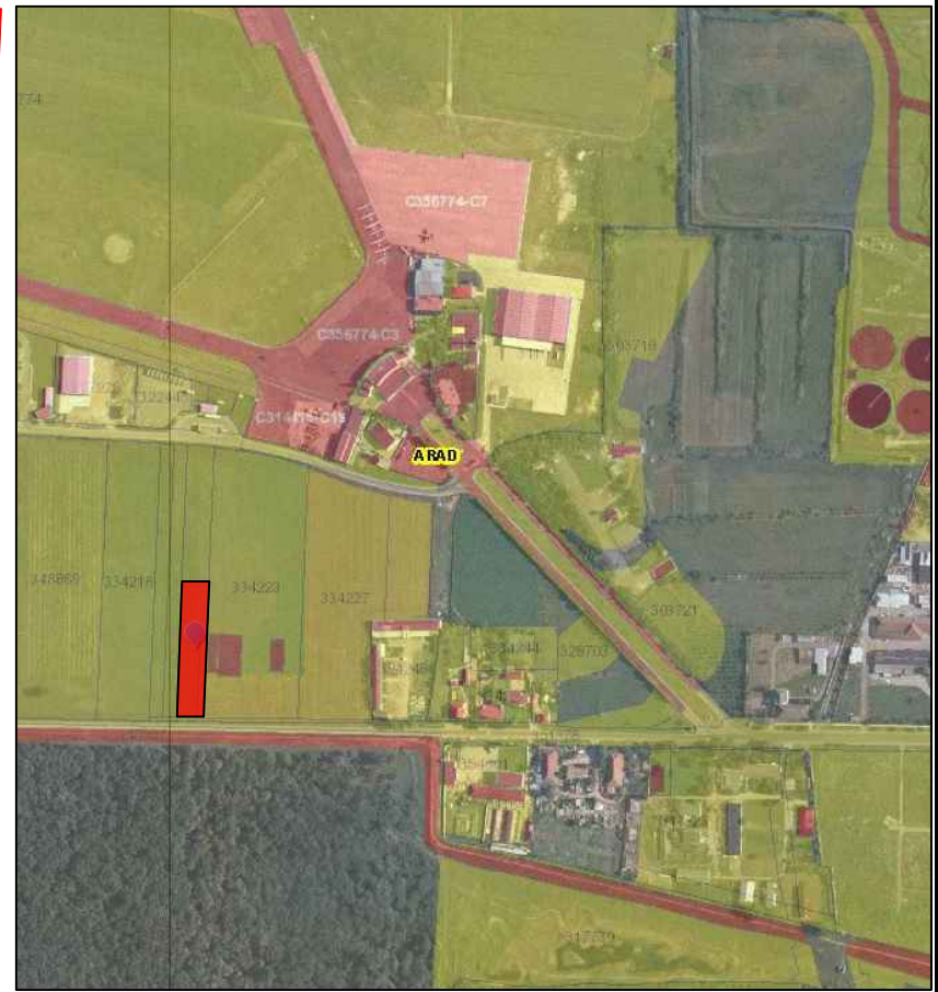
PLAN DE INCADRARE IN ZONA, fara scara