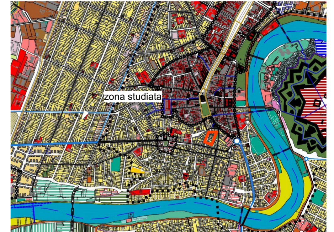
EXTRAS din P.U.G. Arad

MUN. ARAD, STR. DOROBANTILOR, C.F. 326149